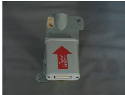
デジタル G センサー純正ブラケット装着